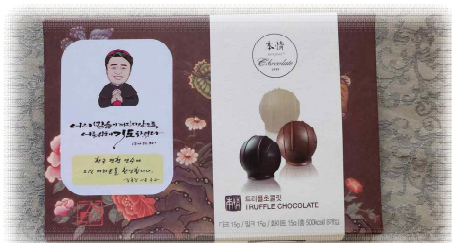
청주교구장 김종강(시문) 주교님 선물